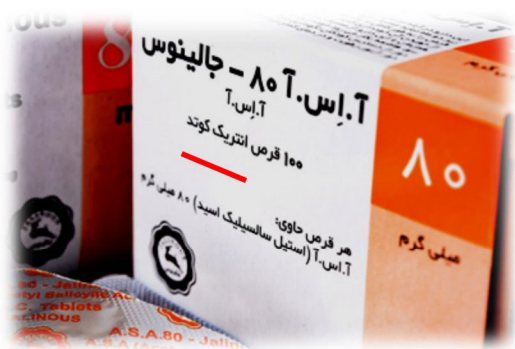
آسپیرین دارای پوشش روده ای

• آسپیرین را در دمای اتاق و در جای خشک نگهداری کنید.