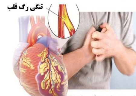
حمله قلبی به علت تنگی رگ قلب