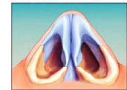
بعد از عمل